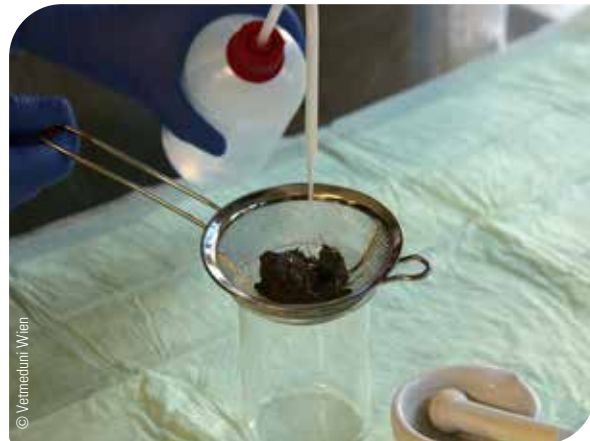
Abb. 9 Erregernachweis mittels Flotation

Kotuntersuchungen mittels Flotation geben ein genaues Bild über den Parasitenstatus in einem Bestand.