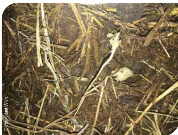
Abb. 11 Typische Konsistenz und Farbe des Kotes bei Saugferkelkokzidiose

Eine Verdachtsdiagnose kann relativ rasch gestellt werden. Das Alter zum Beginn der Symptomatik sowie die relativ typische Konsistenz und Farbe des Kotes (cremig-pastös, gelblich-weißlich) sind dabei gute Orientierungshilfen.