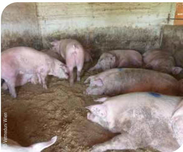
Abb. 5 Planbefestigte Böden als Risikofaktor für eine Infektion mit Spulwürmern

Daher sind zusätzlich zu therapeutischen auch prophylaktische Maßnahmen entscheidend für eine erfolgreiche Parasitenbekämpfung. Während die therapeutischen Maßnahmen darauf abzielen, die Parasiten aus dem Tier zu entfernen, sollen prophylaktische Maßnahmen den Lebenszyklus der Parasiten unterbrechen.