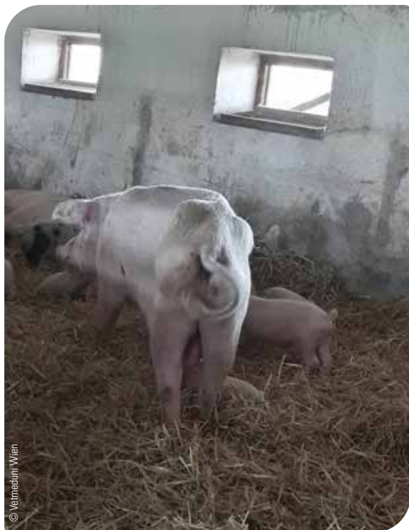
Abb. 3 Sau in schlechtem Ernährungszustand

Der tatsächliche wirtschaftliche Schaden eines Parasitenbefalls und damit der Nutzen einer planmäßigen Parasitenbekämpfung im Betrieb ist aber erst auf den zweiten Blick erkennbar. Parasiten beeinträchtigen das Leistungsvermögen der Tiere: Die Saugferkelverluste können durch unruhigere Sauen steigen, die Tageszunahmen bei Ferkeln und Mastschweinen und die Futterverwertung können sich verschlechtern.