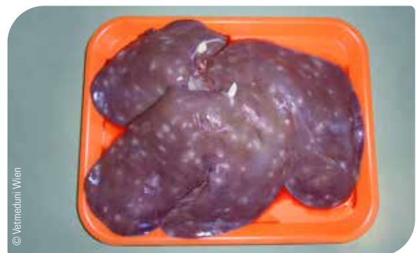
Abb. 2 Milkspots – vernarbtetes Gewebe in der Leber in Folge einer Spulwurminfektion