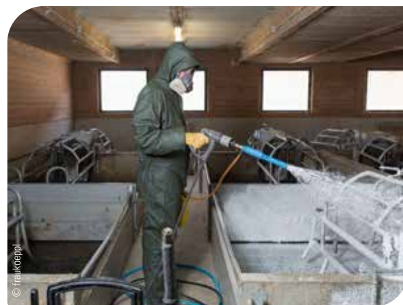
Abb. 12 Einsatz von Desinfektionsmitteln als vorbeugende Maßnahme