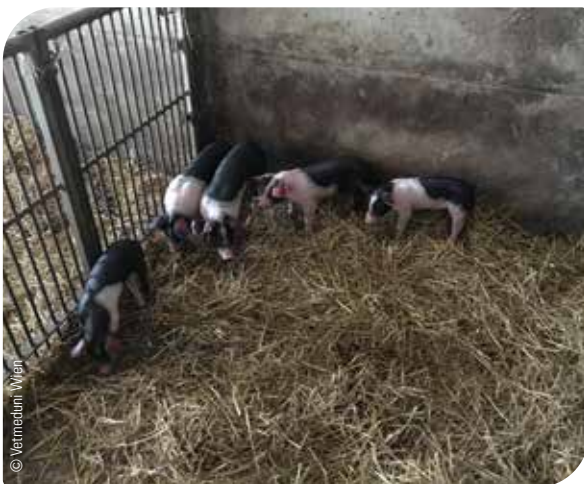
Abb. 6 Einstreu als Risikofaktor für eine Infektion mit Spulwürmern

Dabei gilt es, die Lebenszyklen der jeweiligen Parasiten zu berücksichtigen. Es gibt Parasiten, die einen Zwischenwirt für die Entwicklung benötigen. Für solche Parasiten kann beispielsweise durch die Verhinderung des Kontaktes von Schweinen zum Zwischenwirt (z. B. Regenwürmer) der Infektionszyklus unterbrochen werden. Dies spielt besonders in Betrieben mit Freilandhaltung und Zugang von Schweinen zu unbefestigten Böden eine Rolle.