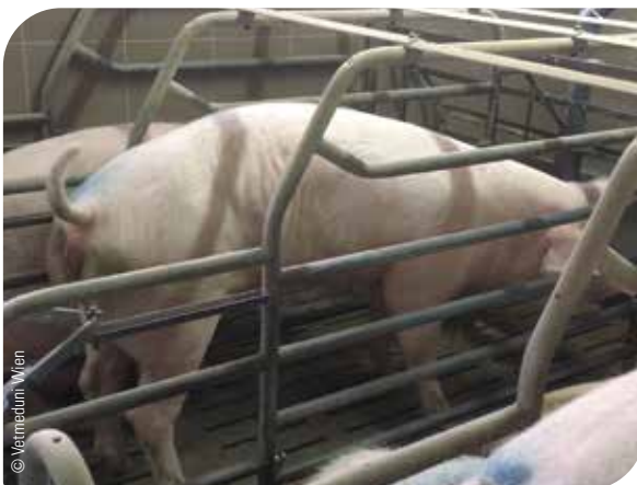
Abb. 1 Sau scheuert sich – Ektoparasiten verursachen Hautreizungen mit Juckreiz

Endoparasiten, wie Spulwürmer, durchwandern ihren Wirt während eines Vermehrungszyklus vom Ei über die Larve bis zum ausgewachsenen Wurm. Während dieses Zyklus sind verschiedene Organe wie Leber, Lunge und Darm betroffen. Die offensichtlichste Folge einer Spulwurminfektion ist vernarbtetes Gewebe an Lebern, das bei der Schlachtung als „Milkspots“ befundet wird. Weniger offensichtlich sind Leistungseinbußen durch verringerte Tageszunahmen und schlechtere Futtermittelverwertung (Hale et al., 1985). Hinzu kommt, dass die Larvenwanderung die Lunge schädigt. In der Folge kann es bei den Tieren zu Husten kommen.