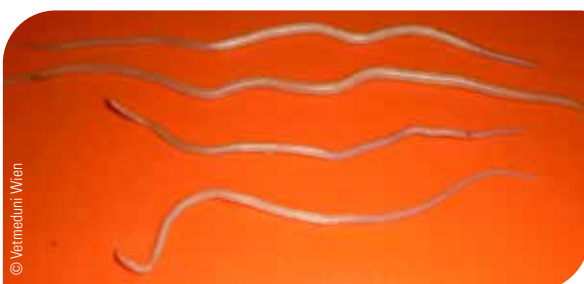
Abb. 8 Spulwürmer