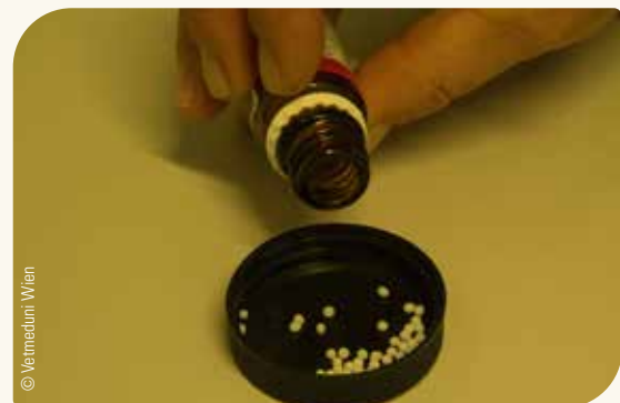
Abb. 14 Homöopathische Unterstützung bei Wurmbefall