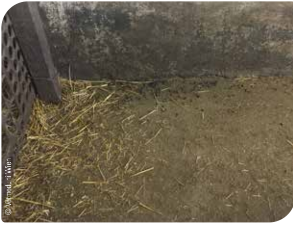
Abb. 4 Schadnagerkot – mangelnde Hygiene im Stall als Risikofaktor für Infektionen