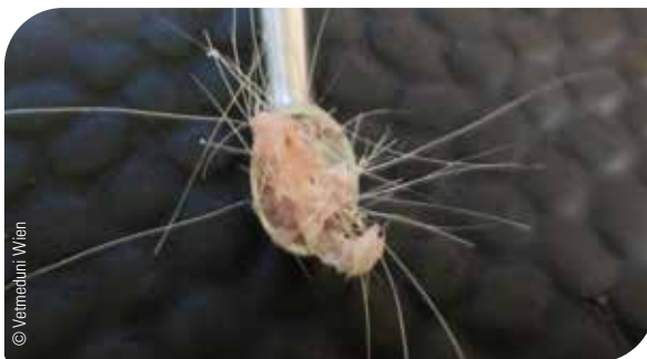
Abb. 15 Hautgeschabsel als Nachweis für Räude

d) Serologie: Antikörper im Blut (Nachweis räudefreier Status)