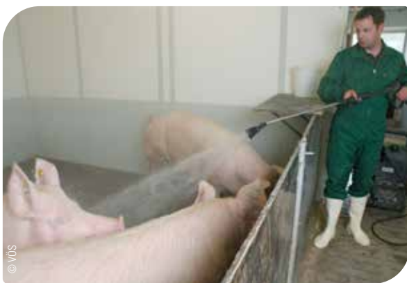
Abb. 13 Waschen der Sauen als vorbeugende Maßnahme