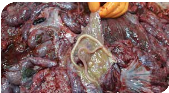
Abb. 7 Spulwurm im Darm

Der Spulwurm ist einer der bedeutendsten Parasiten beim Schwein. Es handelt sich dabei um einen Parasiten, der im Dünndarm seines Wirtstieres, dem Schwein, lebt. Er kann bis zu 20 cm lang werden, ist gelb-weiß bis blass rötlich und erreicht eine Dicke von 4–6 mm. Geschlechtsreife Weibchen können am Tag bis zu 1,5 Millionen Eier produzieren, die über den Kot in die Umgebung ausgeschieden werden.