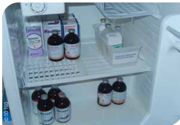
Abb. 19 Hygienische Lagerung von Tierarzneimitteln