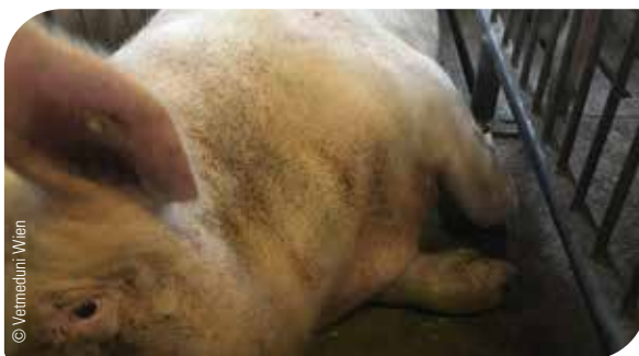
Abb. 16 Hautveränderungen durch Räude