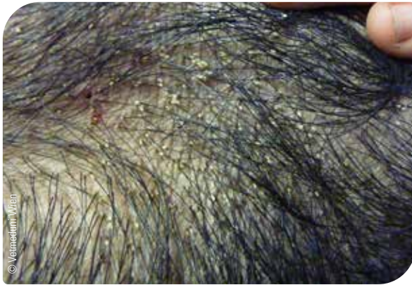
Abb. 18 Schweineläus – Eigelege

(Bereich der Ohren, Nacken und Flanken) beobachtet werden. Manchmal ist die Haut auch entzündet. Das Herumlaufen der Läuse verursacht zudem starken Juckreiz. Ferkel bleiben bei starkem Läusebefall in der Entwicklung zurück und können sogar blutarm werden.