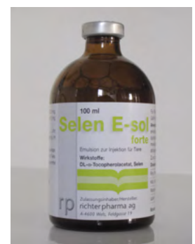
Abb. 5: Selen E-sol®-Tierarzneimittel – enthält Vitamin E und Selen

Beispiel 2: Amproline (links, Abb. 6) ist ein Tierarzneimittel (Antiparasitikum) zur Behandlung von Darmkokzidien bei Hühnern und Puten. Ascarom (rechts, Abb. 7) ist ein biotaugliches Ergänzungsfuttermittel für Geflügel, das zur Stärkung der natürlichen Darmflora eingesetzt werden kann sowie zur Aufrechterhaltung der Leistung bei Endoparasitenbefall. Beide Mittel werden über das Trinkwasser eingegeben.