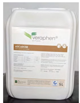
Abb. 7: Ascarom – Ergänzungsfuttermittel zur Stärkung der Darmflora (biotauglich)