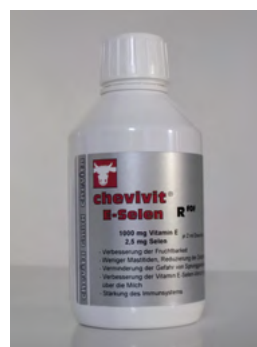
Abb. 4: Chevivit E-Selen® biotaugliches Ergänzungsfuttermittel – enthält Vitamin E und Selen

Beispiel 1: Das Injektionspräparat Selen E-Sol® (rechts, Abb. 5) ist ein Tierarzneimittel, während das über das Maul zu verabreichende Präparat Chevivit E-Selen® (links, Abb. 4) zwar ebenfalls Vitamin E und Selen als Wirksubstanzen enthält, aber als biotaugliches Futtermittel eingestuft ist.