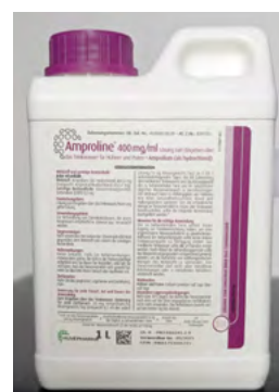
Abb. 6: Amproline – Tierarzneimittel zur Behandlung von Darmkokzidien

Beispiel 2: Amproline (links, Abb. 6) ist ein Tierarzneimittel (Antiparasitikum) zur Behandlung von Darmkokzidien bei Hühnern und Puten. Ascarom (rechts, Abb. 7) ist ein biotaugliches Ergänzungsfuttermittel für Geflügel, das zur Stärkung der natürlichen Darmflora eingesetzt werden kann sowie zur Aufrechterhaltung der Leistung bei Endoparasitenbefall. Beide Mittel werden über das Trinkwasser eingegeben.